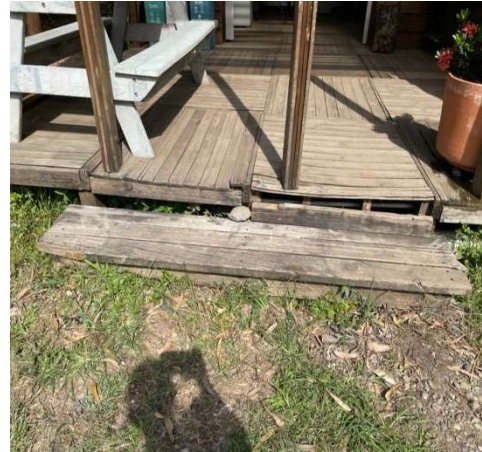
Casa principal del vivero