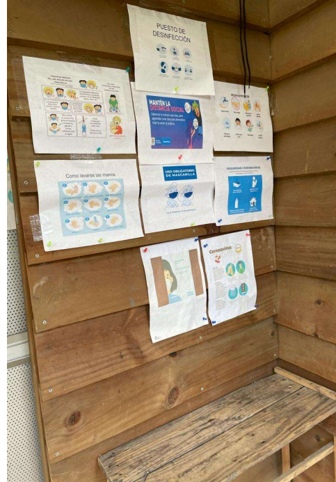
Zona de desinfección